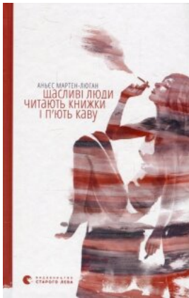
Щасливі люди читають книжки і п'ють каву