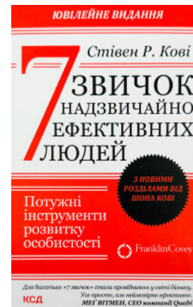
7 звичок надзвичайно ефективних людей. Ювілейне видання