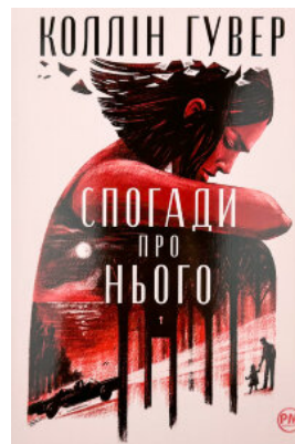
Спогади про нього