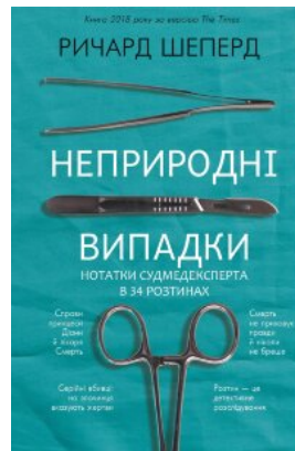
Неприродні випадки. Нотатки судмедексперта в 34 розтинах