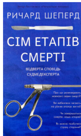
Сім етапів смерті. Відверта сповідь судмедексперта