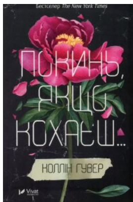
Покинь якщо кохаєш