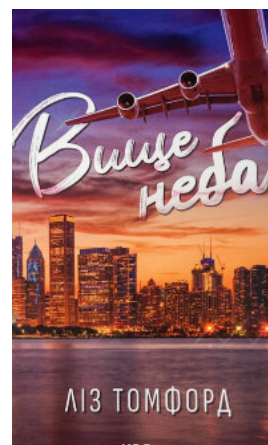
Вище неба. Місто вітрів. Книга 1