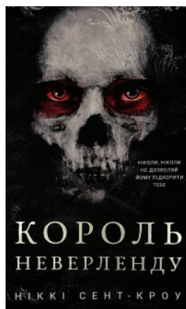
Розпусні загублені хлопці. Книга 1: Король Неверленду