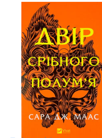
Двір срібного полум'я (Двір шипів і троянд #4)