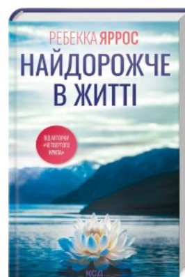
Найдорожче в житті