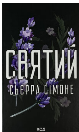
Святий. Книга 3