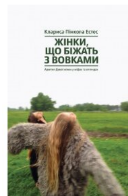
Жінки, що біжать з вовками. Архетип Дикої жінки у міфах та легендах