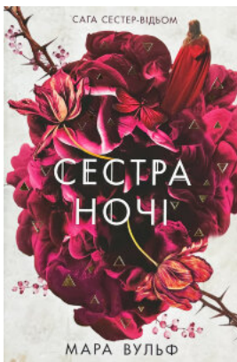
Сестра ночі. Книга 3. Сага сестер-відьом