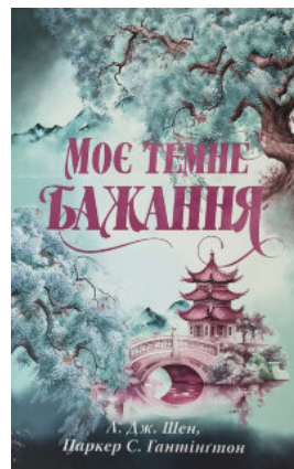
Моє темне бажання. Дорога темного принца. Книга 2