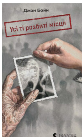
Усі ті розбиті місця