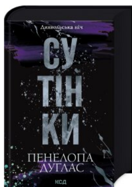
Сутінки. Книга 4