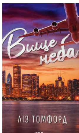
Вище неба. Місто вітрів. Книга 1