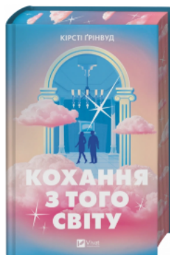
Кохання з того світу