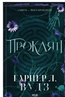
Прокляті. Книга 2