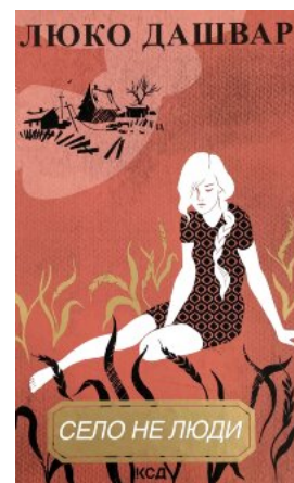
Село не люди