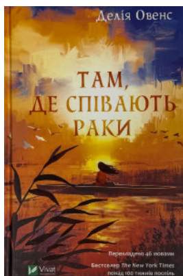
Там, де співають раки