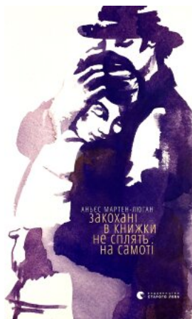
Закохані в книжки не сплять на самоті