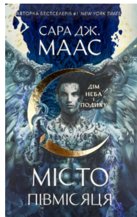
Дім Неба і Подиху. Місто Півмісяця. Книга 2