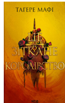
Це зіткане королівство. Книга 1