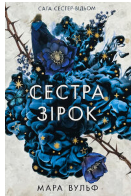
Сестра зірок. Книга 1. Сага сестер-відьом