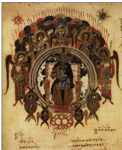
Бог Отец как Ветхий днями в окружении ангельских хоров. Греческая иллюстрация XII века.

Как великие духи времени архангелы чередуются в периодах по 354 года, о которых говорит Тритемий. Их очередь приходит каждые 7 \times 354,3 = 2480 лет. Последовательность великих духов времени, однако, иная. Если мы представим себе планетные сферы как семь тонов небесной гаммы, то эта последовательность образует в музыке сфер квинтовый круг: Орифиил, Анаил, Захариил, Рафаил, Самаил, Гавриил, Михаил. Об этом великом круге говорил и Будда, когда провозглашал, что великое колесо дхармы оборачивается один раз за 25 веков и в каждом цикле приходит один новый будда. Геродот намекает, что египтяне знали об этом круге уже в архаический период.