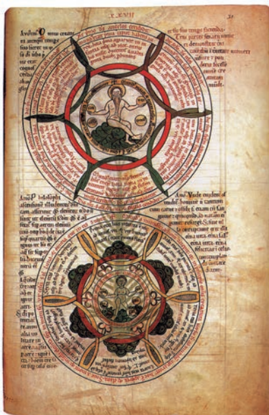
Семь мировых веков и соответствующие им периоды жизни человека. Ламберт из Сент-Омера, 1120.

Давайте назовем величайших мировых поэтов: Гомер, Калидаса, Ли Бо, Абу Нувас, Данте, Гете и др. Они образуют 500-летний ритм, который совпадает с периодами архангела Анаила. А как иначе, ведь Анаил – это не кто иной, как древневавилонская Инанна-Афродита, богиня любви