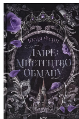
Даїре: мистецтво обману. Книга 1