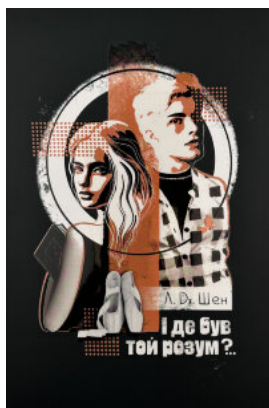
І де був той розум?..