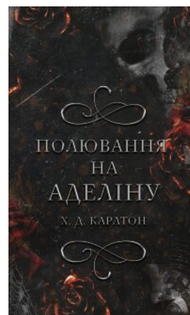
Гра в kota і мишу. Книга 2: Полювання на Аделіну