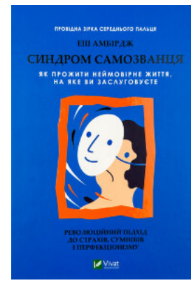
Синдром самозванця. Як прожити неймовірне життя, на яке ви заслугуєте