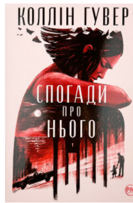
Спогади про нього