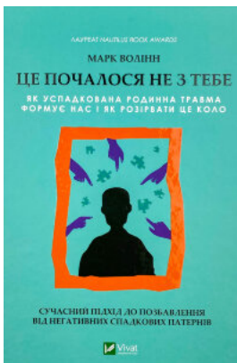
Це почалося не з тебе. Як успадкована родинна травма формує нас і як розірвати це коло