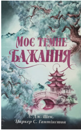
Моє темне бажання. Дорога темного принца. Книга 2