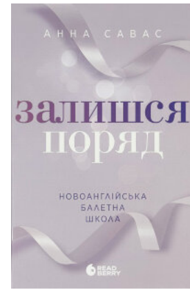
Залишся поряд. Новоанглійська балетна школа #2