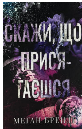
Скажи, що присягаєшся