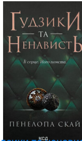
Гудзики та ненависть. Книга 2