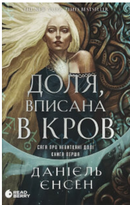
Доля, вписана в кров. Сага про невиткані долі. Книга 1