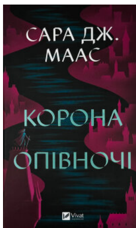
Корона опівночі. Книга 2