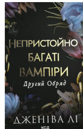
Другий Обряд. Непристойно багаті вампіри. Книга 2