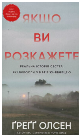
Якщо ви розкажете. Реальна історія сестер, які вирости з матір'ю-вбивцею