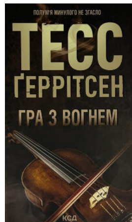
Гра з вогнем