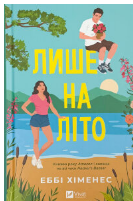
Лише на літо