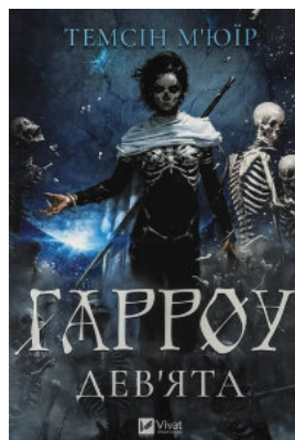
Гарроу Дев'ята (Запечатана гробниця #2)