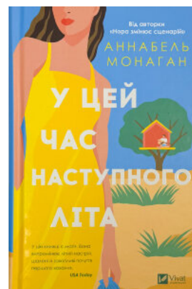
У цей час наступного літа