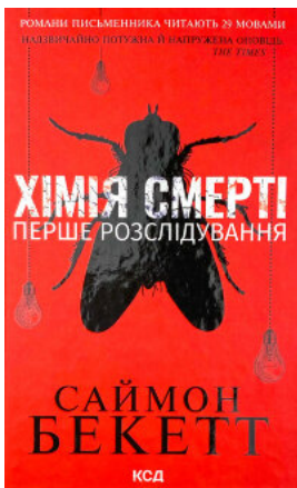
Хімія смерті. Перше розслідування