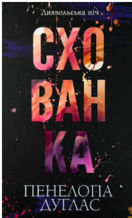
Схованка. Книга 2