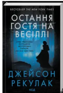
Остання гостя на весіллі