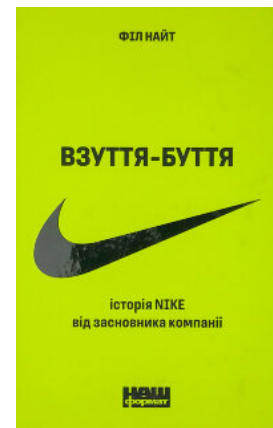
Взуття-буття. Історія Nike, розказана її засновником