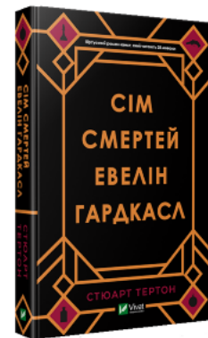
Сім смертей Евелін Гардкасл