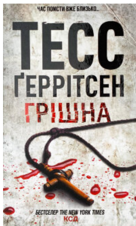
Грішна. Книга 3