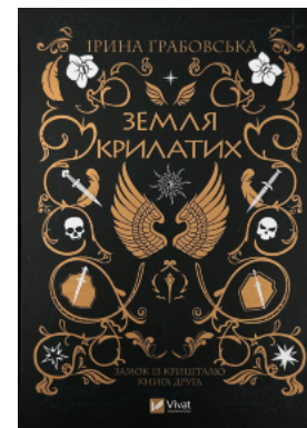
Земля Крилатих. Трилогія «Замок із кришталю». Книга 2