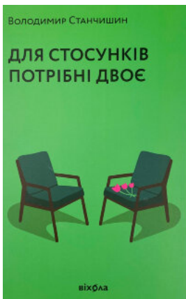
Для стосунків потрібні двоє

Ніколи не їжте наодинці та інші секрети успіху завдяки широкому колу знайомств