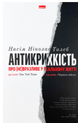
Антикрихкість. Про (не)вразливе у реальному житті