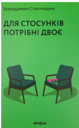
Для стосунків потрібні двоє