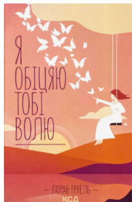
Я обіцяю тобі волю