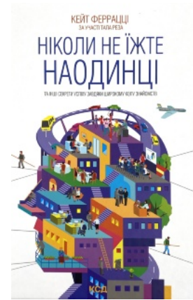
Ніколи не їжте наодинці та інші секрети успіху завдяки широкому колу знайомств