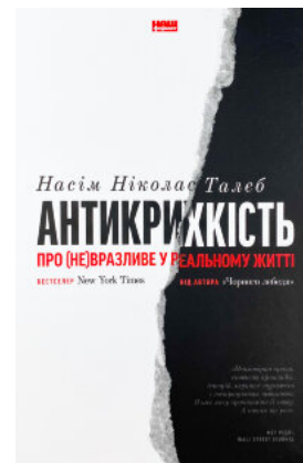
Антикрихкість. Про (не)вразливе у реальному житті