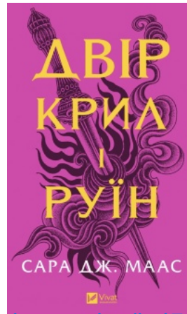
Двір крил і руїн (Двір шипів і троянд #3)