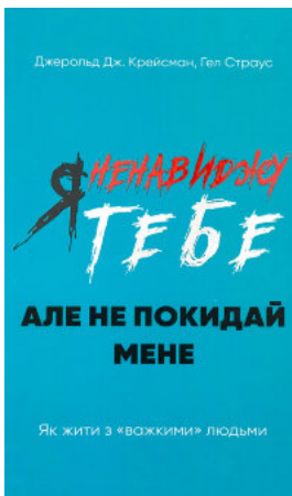
Я ненавиджу тебе, але не покидай мене. Як жити з «важкими» людьми