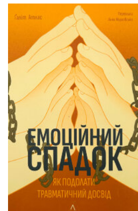
Емоційний спадок. Як подолати травматичний досвід