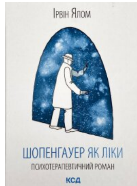
Шопенгауер як ліки