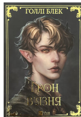
Трон в'язня. Книга 2