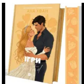
Ігри (Twisted #2)