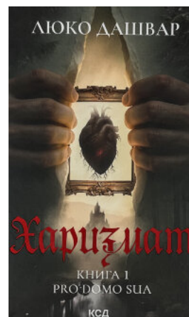
Харизмат. Pro domo sua. Книга 1