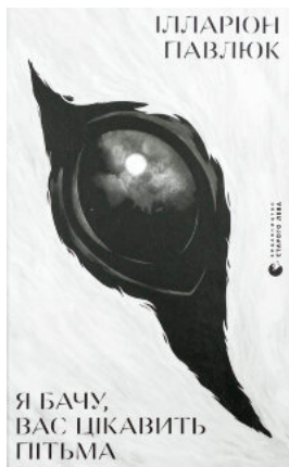
Я бачу, вас цікавить п'ятьма