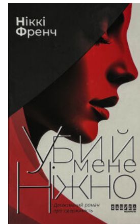
Убий мене ніжно