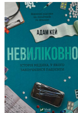
Невиліковно. Історія медика, у якого закінчилися пацієнти