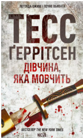
Дівчина, яка мовчить. Книга 9