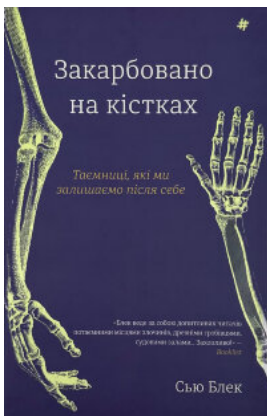
Закарбовано на кістках. Таємниці, які ми залишаємо після себе