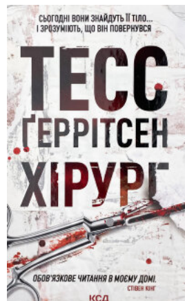
Хірург. Книга 1