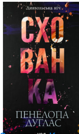
Схованка. Книга 2