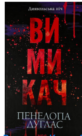
Вимикач. Книга 3