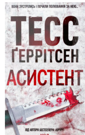
Асистент. Книга 2