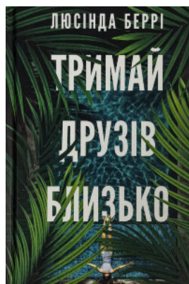
Тримай друзів близько