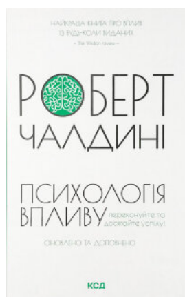
Психологія впливу. оновлено та доповнено