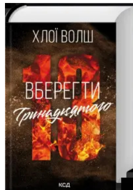
Вберегти Тринадцятого. Книга 2