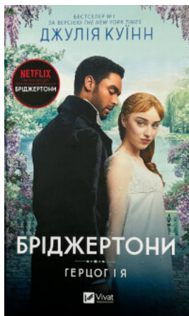
Бріджертони. Герцог і я