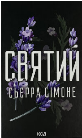
Святий. Книга 3