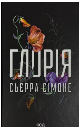
Глорія. Книга 2.5