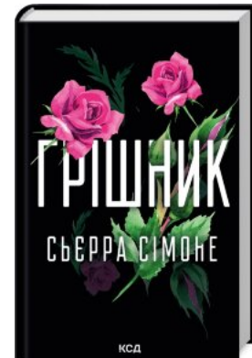
Гришник. Книга 2