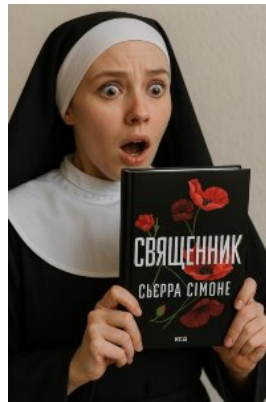
Священник. Книга 1