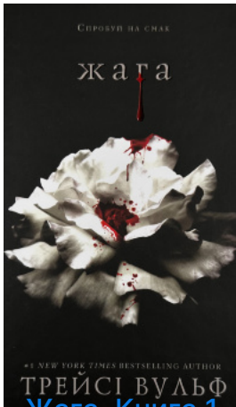
Жага. Книга 1