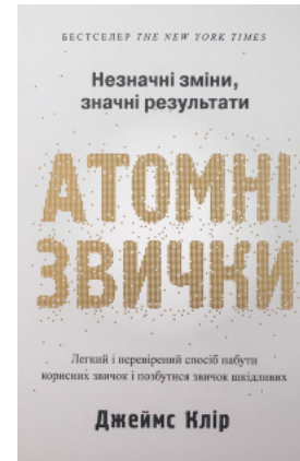
Атомні звички. Легкий і перевірений спосіб набути корисних звичок і позбутися звичок шкідливих