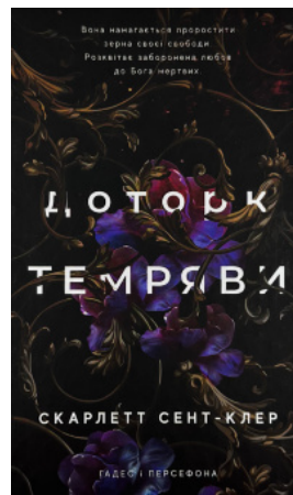
Доторк темряви. Гадес і Персефона. Книга 1