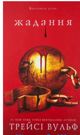
Жага. Книга 3: Жадання