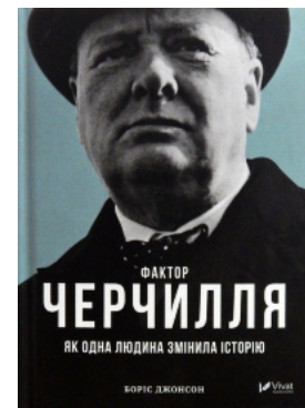
Фактор Черчилля. Як одна людина змінила історію