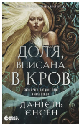
Доля, вписана в кров. Сага про невиткані долі. Книга 1