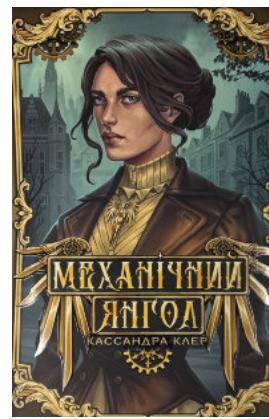
Механічний янгол. Пекельні пристрої. Книга 1