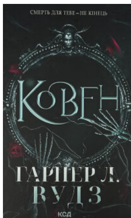
Ковен. Книга 1