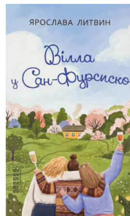
Вілла у Сан-Фурресско