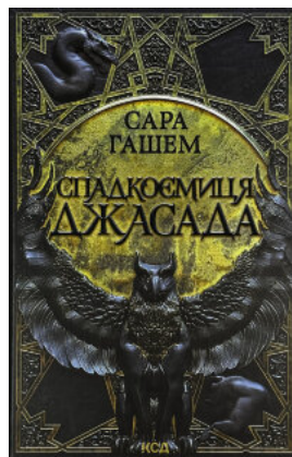
Спадкоємиця Джасада. Книга 1