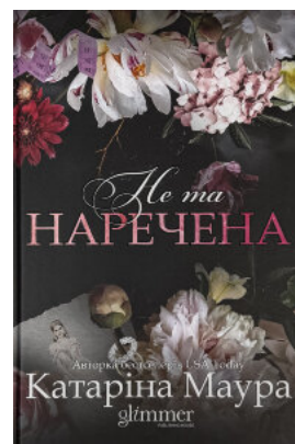
Не та наречена. Імперія Віндзорів. Книга 1