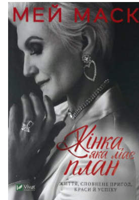
Жінка, яка має план. Життя, сповнене пригод, краси й успіху