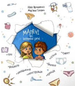
Малечі про інтимні речі