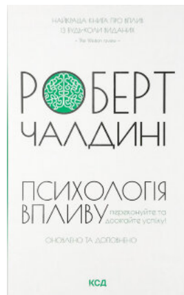
Психологія впливу. Оновлено та доповнено