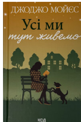
Усі ми тут живемо