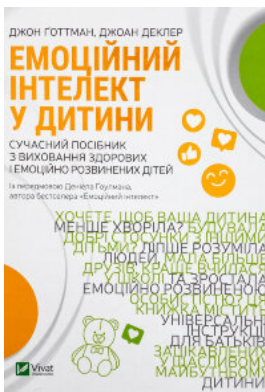
Емоційний інтелект у дитини