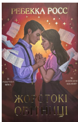
Жорстокі обітниці. Листи зачарування. Книга 2