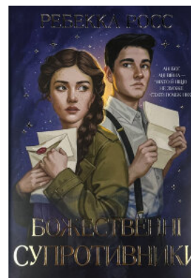
Божеественні супротивники. Листи зачарування. Книга 1