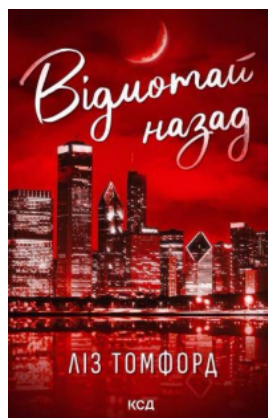
Відмотай назад. Місто вітрів. Книга 5