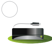
Зовнішній жорсткий диск