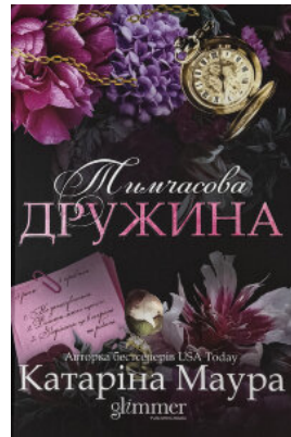
Тимчасова дружина. Імперія Віндзорів. Книга 2