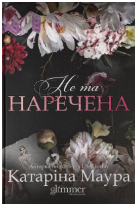
Не та наречена. Імперія Віндзорів. Книга 1