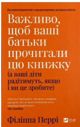
Важливо, щоб ваші батьки прочитали цю книжку (а ваші діти радітимуть, якщо і ви це зробите)