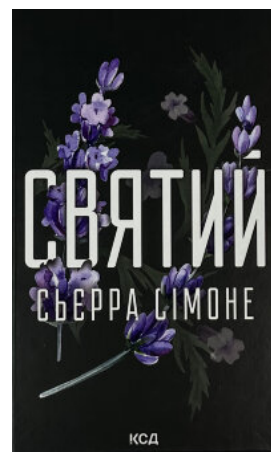
Святий. Книга 3