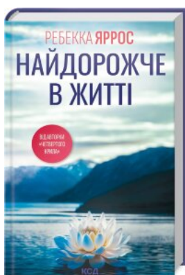
Найдорожче в житті