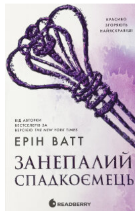
Родина Роялів. Книга 4. Занепалий спадкоємець