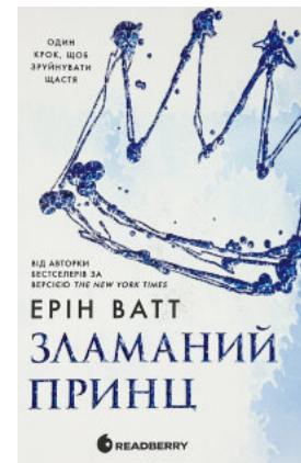
Родина роялів. Зламаний принц. Книга 2