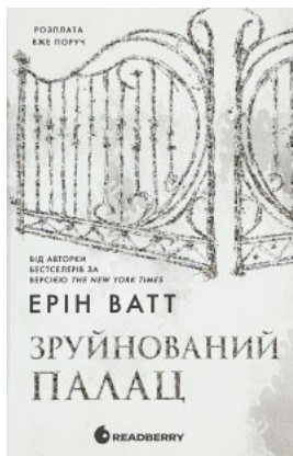
Родина Роялів. Книга 3. Зруйнований палац