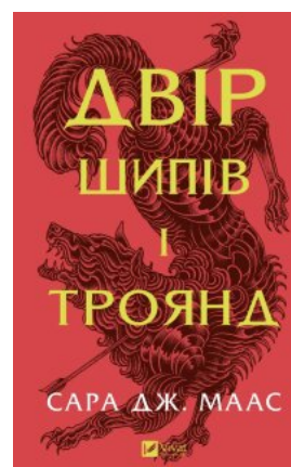
Двір шипів і троянд