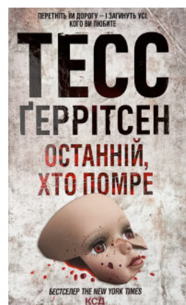
Останній, хто помре. Книга 10