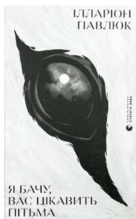
Я бачу, вас цікавить п'ятьма