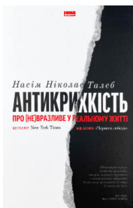
Антикрихкість. Про (не)вразливе у реальному житті