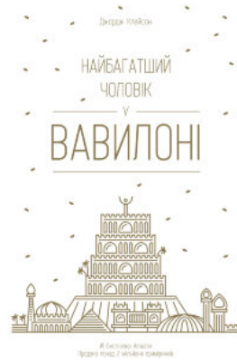
Найбагатший чоловік у Вавилоні