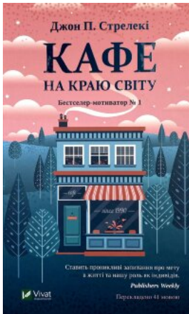
Кафе на краю світу