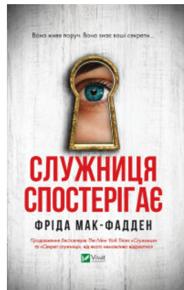
Служниця спостерігає (Служниця #3)