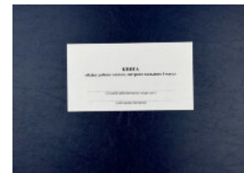
Книга обліку роботи машин витрати пального і масел, додаток 84 (додаток 82)