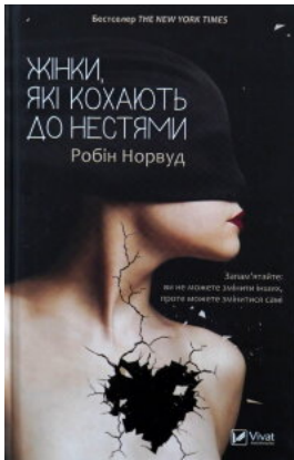
Жінки, які кохають до нестями