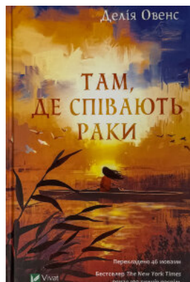
Там, де співають раки