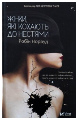
Жінки, які кохають до нестями