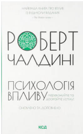
Психологія впливу. Оновлено та доповнено