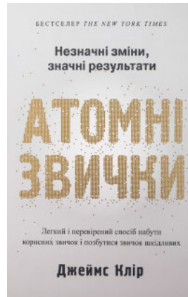
Атомні звички. Легкий і перевірений спосіб набути корисних звичок і позбутися звичок шкідливих