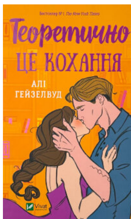
Теоретично це кохання