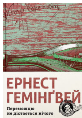
Перемождю не дістається нічого