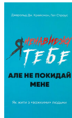
Я ненавиджу тебе, але не покидай мене. Як жити з «важкими» людьми