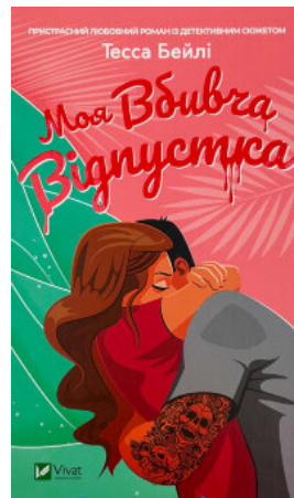
Моя вбивча відпустка