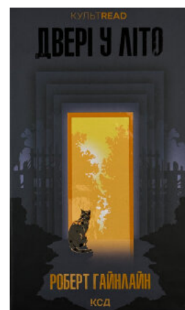
Двері у Літо