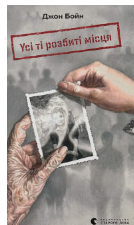
Усі ті розбиті місця