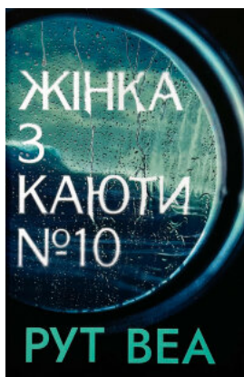
Жінка з каюти №10