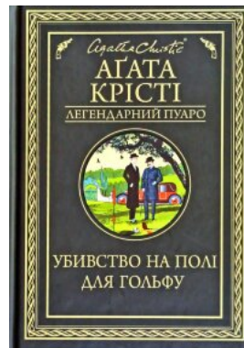
Убивство на полі для гольфу