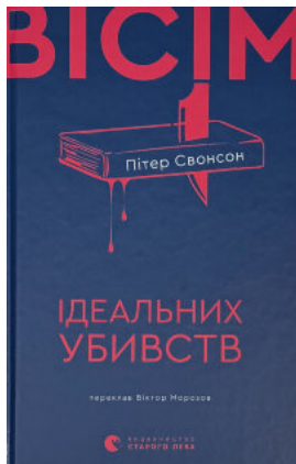
Вісім ідеальних убивств